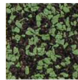
マーブルグリーン