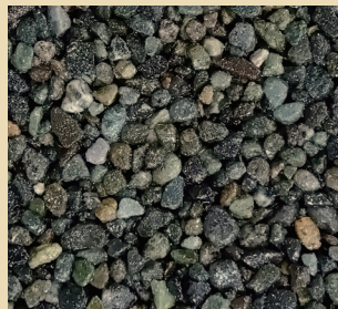
新大磯 (シンオオイソ)