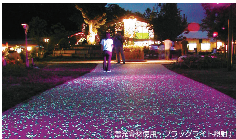
(蓄光骨材使用・ブラッグライト照射)